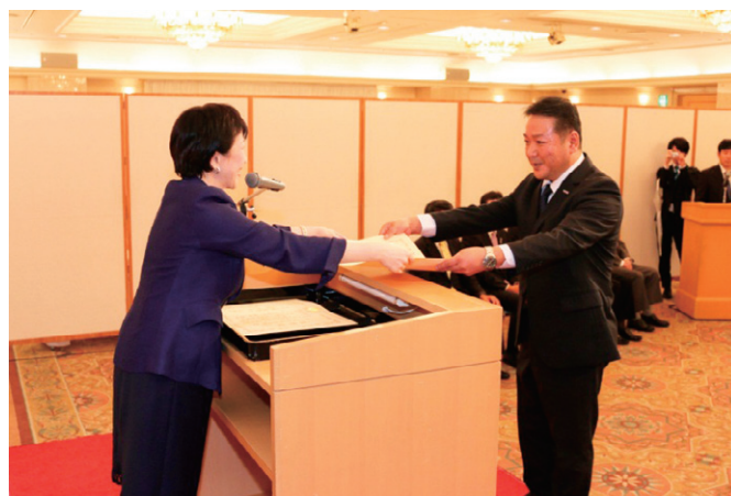
高市総務大臣から受賞事業所へ感謝状を贈呈