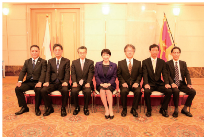
総務大臣感謝状受賞事業所